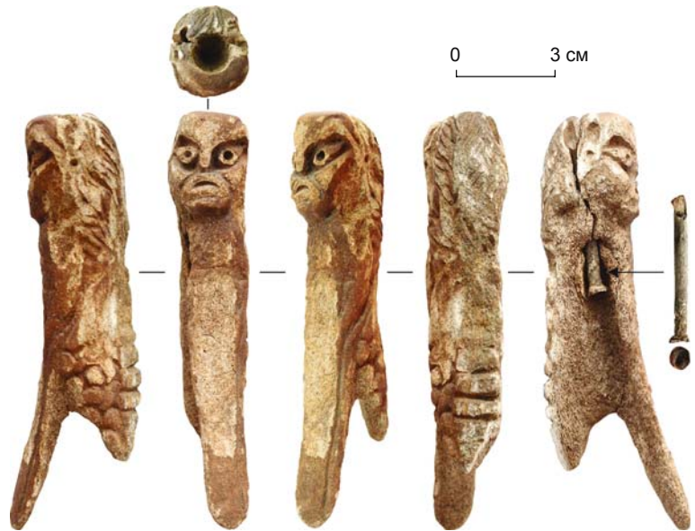
Рис. 1. Антропоморфная фигурка из рога с р. Дудет (Тисульский р-н Кемеровской обл.).

Изделие условно можно разделить на четыре плоскости. На верхнем конце узкой дугообразной стороны вырезано рельефное изображение головы человека (высота 31 мм, ширина 23 мм). Теменная часть уплощена, причем преднамеренно, т.к. сверху сделано углубление конической формы (диаметр по краю 11 мм, глубина 16 мм). Несмотря на это уплощение, абрис лица ближе к овалу. Но нельзя не обратить внимание на выступающие, хотя и немного, скулы. Лицо человека передано в технике контррельефа. Лоб, нос и рот находятся в одной плоскости. Большие миндалевидные глаза с крупными круглыми зрачками в виде ямок – наиболее выразительный элемент лица антропоморфного существа. Их рельефная форма передана подрезкой по контуру, но так, чтобы одновременно обозначить прямой короткий нос, а также брови, одна из которых немного приподнята и изогнута под углом, а другая волнообразная и дополнительно подчеркнута слегка углубленной линией на лбу.